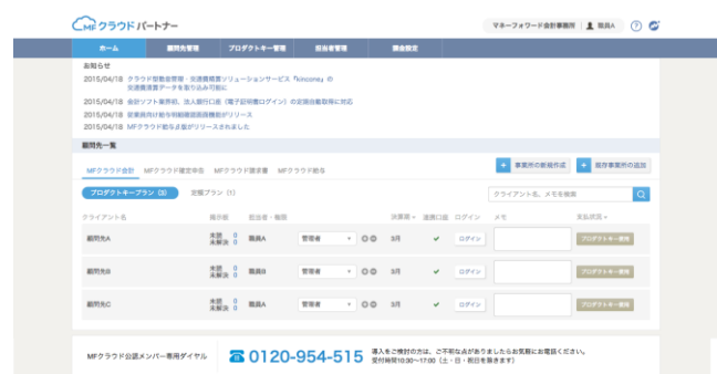
顧問先管理サービス『MFクラウドパートナー』

『MFクラウド会計・確定申告』は、銀行やクレジットカード等 2,000 を超える金融関連サービスから取引情報を自動取得することにより、記帳業務を簡単に楽に参りましたが、一方で一部の現金取引などで必要となる手入力仕訳に関しては、インターネットを介しての入力となるため、従来の会計事務所の職員の方々や中小企業の経理担当の方々から入力レスポンスを早めるご要望を頂戴しておりました。